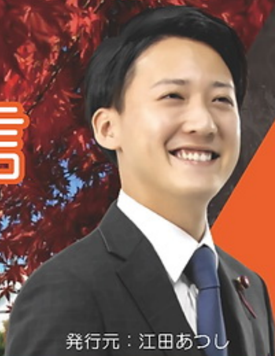
発行元：江田あつし